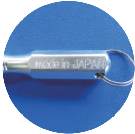
made in JAPAN